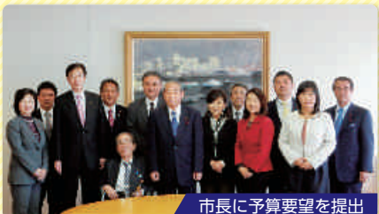
市長に予算要望を提出