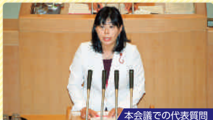
本会議での代表質問