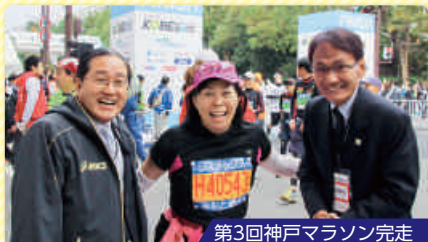
第3回神戸マラソン完走