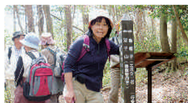
山々を歩き、自然保護と環境政策を訴える