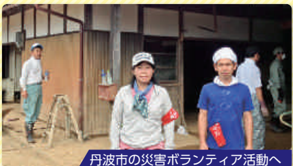
丹波市の災害ボランティア活動へ