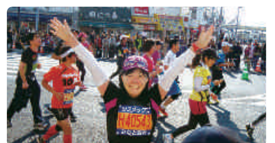
第3回神戸マラソン42.195km完走！ たくさんの声援に感謝

● 議会活動 ：文教経済委員会、都市防災委員会、文教子ども委員会副委員長、大都市行財政制度に関する特別委員会副委員長、都市計画審議会委員を歴任。現在、福祉環境委員会委員、外郭団体に関する特別委員会理事、神戸市農業委員会委員。