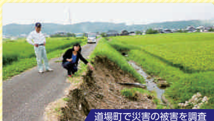
道場町で災害の被害を調査