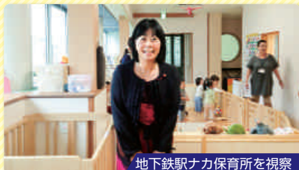
地下鉄駅ナカ保育所を視察