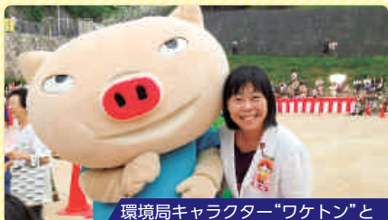
環境局キャラクター「ワケトン」と