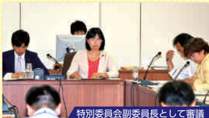
特別委員会副委員長として審議